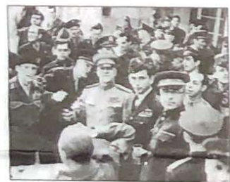
Ο Βρετανός στρατηγός Μάιζοντ Μοντγκομερί, ο Αμερικανός Ντσεϊν Λίγγιντσοντ, ο Σοβιετικός Γκερσάρε Ζούκοβ και ο Βρετανός πύραυλος Λόουις Γέντερ (από αριστερά προς τα δεξιά) κατά την υπογραφή της συνθήκης παράδοσης της ναζιστικής Γερμανίας στις 7.5.1945.

σαν την πορεία της ανθρώπινης ιστορίας και άφρον ανειδίγητα ίσχυε στη μνήμη των λαών της γης.