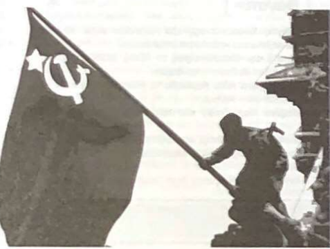
Κόκκινο της νίκης. Σοβιετικοί στρατιώτες υψώνουν τη σοβιετική σημαία στο γερμανικό Κοινοβούλιο.

στην αβυσσότητα που βιώνει το μεγαλύτερο μέρος του πληθυσμού της γης. Ο νόμος του κεφαλαίου και τα συμφέροντα των πολιτικών καθορίζουν τους κανόνες της ζωής μας, γεννούν την αβυσσότητα για το άτομο και συντηρούν την υπαχθική μας αγένεια για την καθημερινή καταστροφή που συντελείται στο περιβάλλον που ζούμε και στον πλανήτη μας γύρω. Η νίκη των λαών κατά του φασισμού μετατρέπεται σ' ένα σύστημα αδηφύγου καπιταλισμού, με την κυριαρχία του μεγάλου κεφαλαίου και των πολιτικών που το εκπροσωπούν. Κρίσιμ στοιχείο στο σημερινό κόσμο είναι η κυριαρχία της βίας που τροφοδοτείται από το εμπορικό και το θρησκευτικό φανατισμό, όπως ακριβώς συνέβαινε στα μαύρα χρόνια του μεσοίωνα. Την κατάσταση αυτή εξήγησαν και συντήρησαν οι ΗΠΑ που σαν μοναδική υπερέδωχη της εποχής μας υπαγορεύουν και σηκώνουν τα συμφέροντα του μεγάλου κεφαλαίου, που γεννά τη φτώχεια και την εξαθλίωση και προκαλεί τη βία που βλέπουμε να κυριαρχεί παντού. Πριν από χρόνια γράφτηκε ένα από τα σύμβολα του νησικού πολέμου, το τίχος του Βερολίνου, για το οποίο πολλά έχουν ειπωθεί, όντας το σημείο αναφοράς της δικτατικής προπαγάνδας εναντίον των τότε υπαρκτού σοσιαλισμού. Σήμερα τα άλλοτε θύματα του Χίτλερ, δηλαδή οι Εβραίοι, προσηλυτιστές οι όλοι, και σήμερα υπαγορεύουν την εποχή μας, έχουν κατασκευάσει το δικό τους τίχος που χωρίζει σ'α μια πόλη αλλά μια ολοκλη-